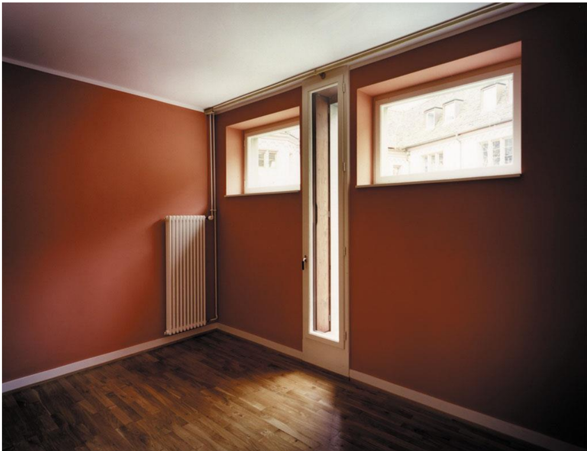
An der Stelle der ehemaligen Zellenwand befindet sich nun ein raumhohes Fenster.

Von langen Gängen aus gehen die einzelnen Zimmer ab. Die Türen, welche den Originalmassen der ehemaligen Zellentüren entsprechen, sind gerade hoch genug, um die Zimmer mit eingezogenem Kopf zu betreten. Breite Koffer passen nur seitwärts durch die Tür. Markante Blendrahmen und dicken Mauern inszenieren den Eintritt in die Zimmer. Die ehemalige Nutzung bleibt hier spürbar. Zwei Zellen wurden jeweils zu einem Zimmer zusammengefügt. Jedes Zimmer ist in einer eigenen Farbe gestrichen. Von Gelb zu Rot und von Grün zu Blau. Die Farbabfolge folgt der Farblehre Goethes. Gegenläufig angeordnet und um eine Einheit verschoben kommen in jedem Zimmer zwei unterschiedliche Farbtöne zur Anwendung. Jedes der insgesamt zwanzig Zimmer bekommt so einen individuellen, farblichen Charakter.